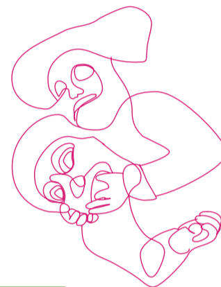
L'arracheur de dents

Avant d'arriver sur la place du château, remarquez l'insolite arracheur de dents d'après le haut-relief à découvrir dans l'église Notre-Dame. Elle a été réalisée sous la dynastie des Laval-Monfort qui est à la tête de la baronnie de Vitré aux XV e et XVI e siècles. Seigneurs bâtisseurs, les Laval-Monfort font aménager et construire de nombreux édifices qui forgent l'identité de Vitré. Compagnon des rois de France pendant les campagnes d'Italie, le baron Guy XVI y découvre l'art renaissant et l'introduit en Bretagne par Vitré. Vers 1525, il fait d'ailleurs construire au château une absidiole en tuffeau de style Renaissance. Approchez-vous du fossé du château et observez les arts et les loisirs à la cour des barons de Vitré.